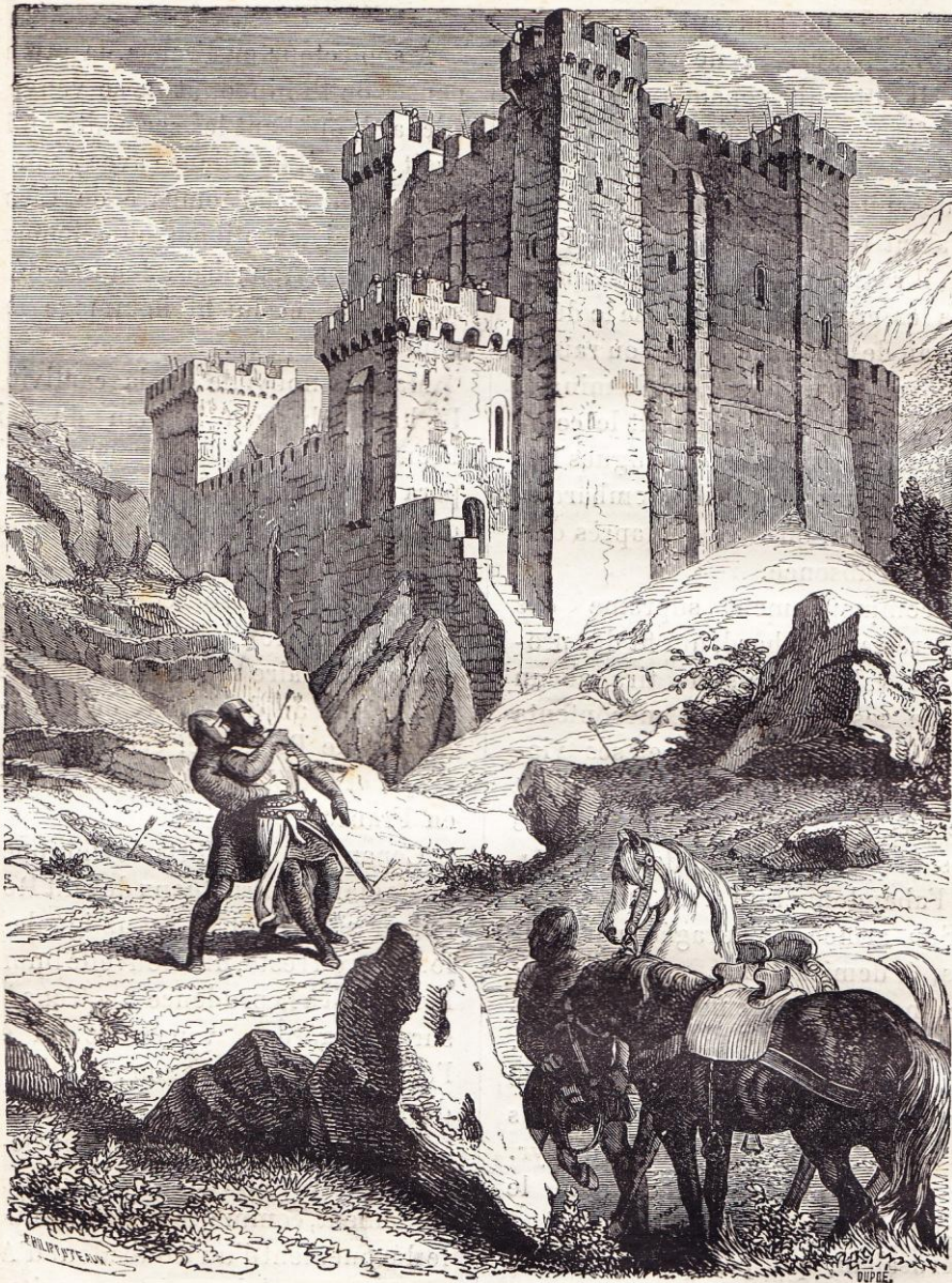
Mort de Richard Cœur-de-Lion devant le château de Chalus.

fabuleuse, blessait presque tous les chefs par son orgueil insupportable ; il fit jeter dans un fossé l'étendard de Léopold, duc d'Autriche. Nous verrons plus tard comme celui-ci vengea cette injure.