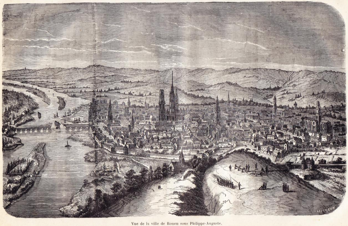
Vue de la ville de Rouen sous Philippe-Auguste.