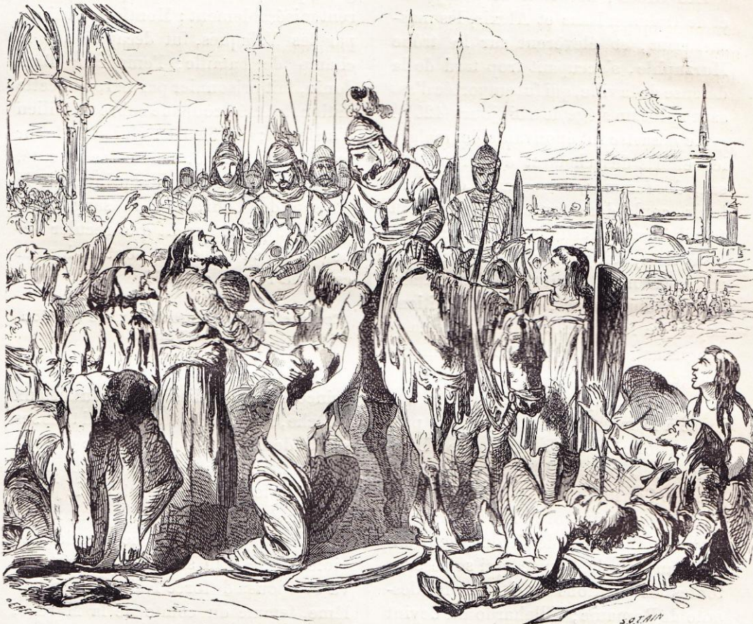
Baudouin nommé empereur de Constantinople, après la prise de cette ville par les croisés (1204).

Aussi les croisés accueillirent-ils avec enthousiasme l'occasion de satisfaire leur vengeance, que leur fit offrir le jeune Alexis l'Ange, fils de l'empereur Isaac, qui avait été renversé du trône et aveuglé par la barbarie de